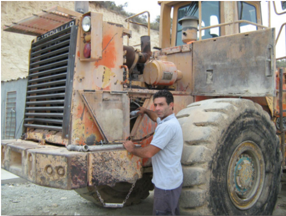
Der Mechaniker füllt PowerShot® 10 in das Motoröl ein.